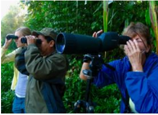
Muyuna Lodge 📍